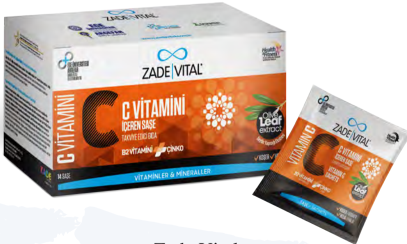
Zade Vital C Vitamini İçeren Takviye Edici Gıda